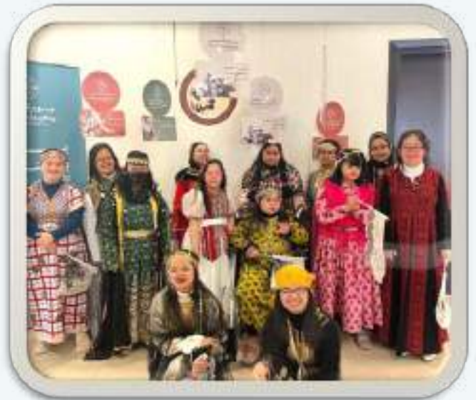
الاحتفال بيوم التأسيس