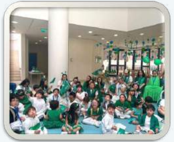
الاحتفال باليوم الوطني السعودي