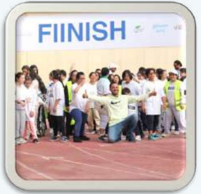
فعالية هيا نمشي معاً